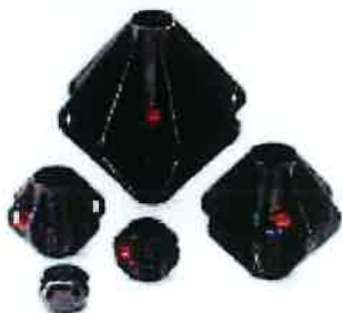
Uključen komplet vodiča za cijevi od 25 mm.

Za cijevovode 1½" do 6" (40 do 150 mm) dužine do 30 metara.